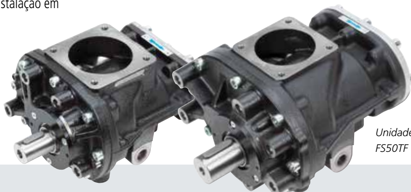
Unidade compressora FS50TF